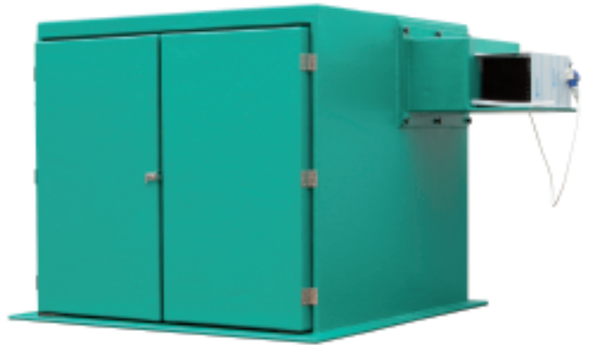
Kadaverzelle Typ 2 mit Wandkühler