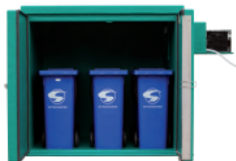
Lagerkapazität: 9 Stück Container 120 oder 140 Liter