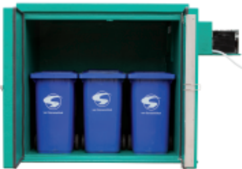
Lagerkapazität: 6 Stück Container 240 Liter