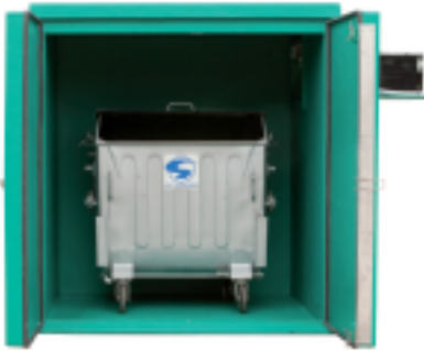
Lagerkapazität: 1 Stück Stahlcontainer 1100 Liter