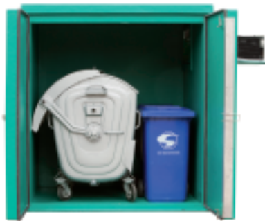
Lagerkapazität: 1 Stück Stahlcontainer 1100 Liter + 2 Minicontainer 240 Liter