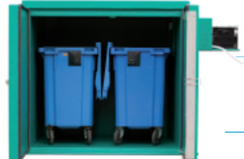
Lagerkapazität: 2 Stück Container 770 Liter