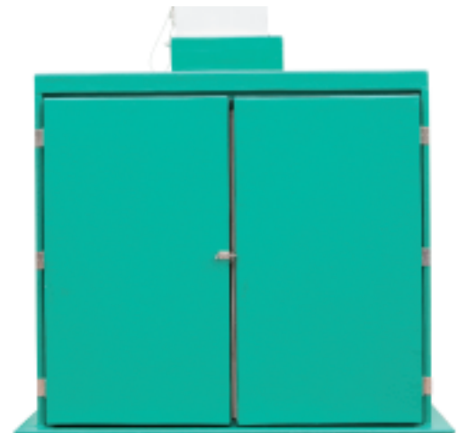
Kadaverzelle Typ 3 mit Deckenkühler